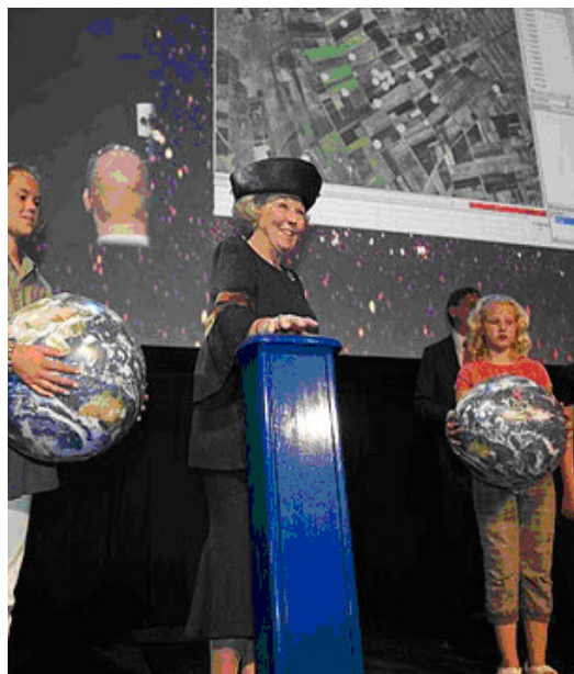
Koningin Beatrix verricht de officiële openingshandeling van radiotelescoop LOFAR door het drukken op een knop.

Aanmelden/afmelden voor deze nieuwsbrief kan via de website http://lofarzone.nl/nieuwsbrieven